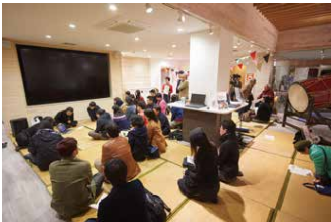
◀ 昨年度オープニングトークの様子

会場 秋田ケーブルテレビ (CNA) エントランス (秋田市八橋南一丁目 1-3)